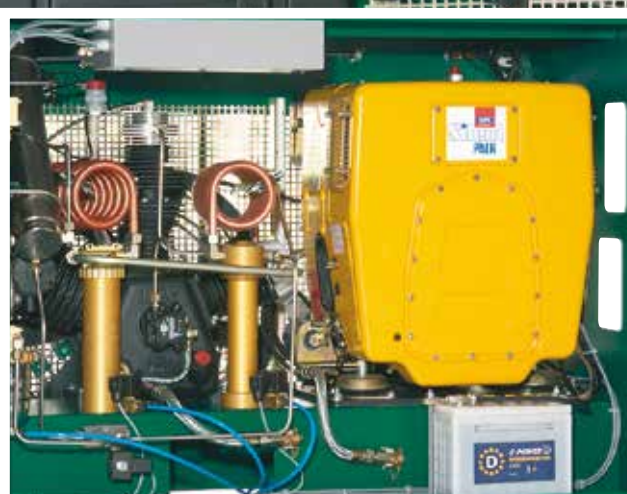
LW 450 D Vue arrière