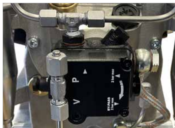
NUEVO - Bomba de aceite regulable con tamiz de aceite